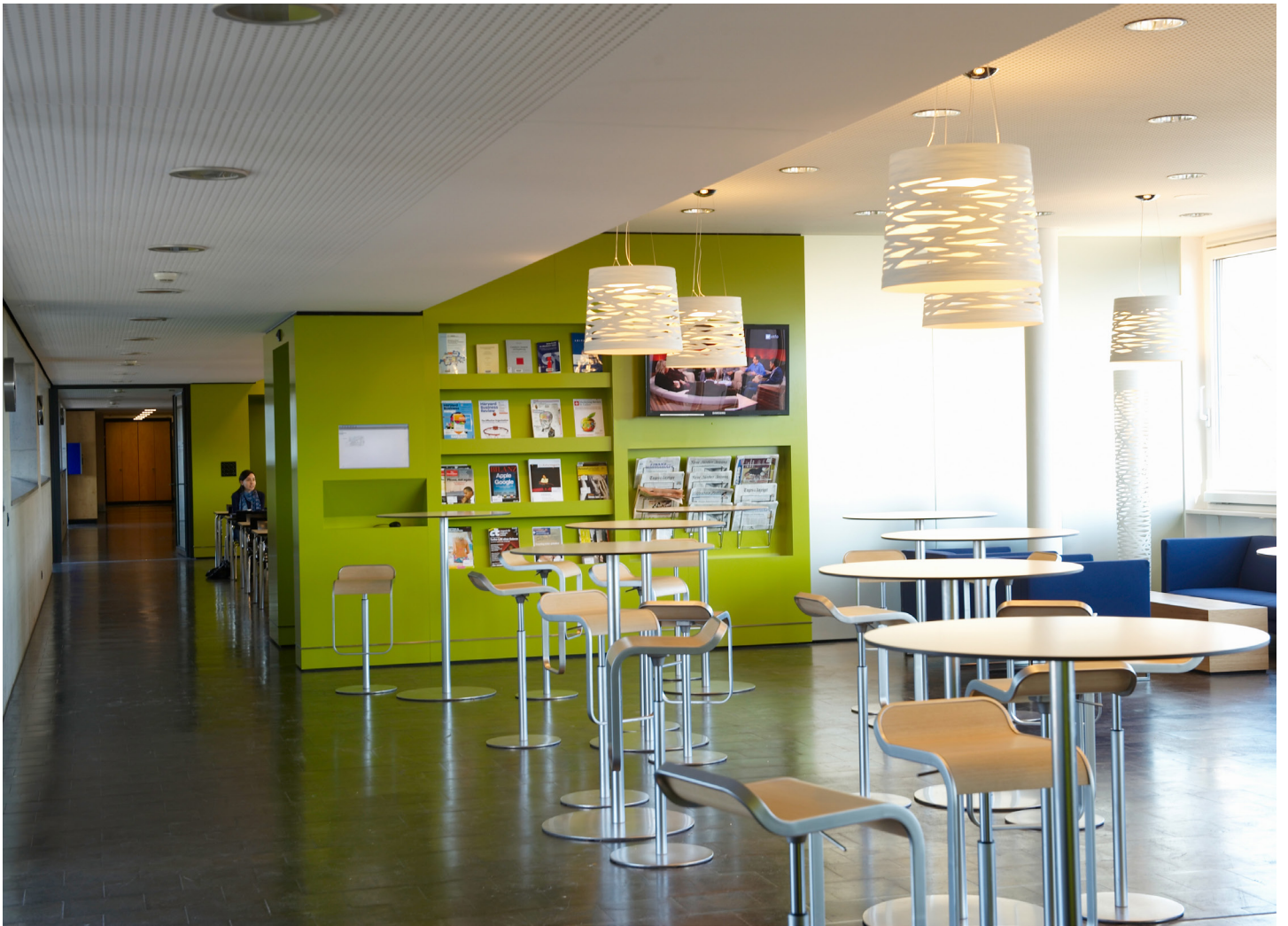
Mensa Hochschule für Wirtschaft Luzern