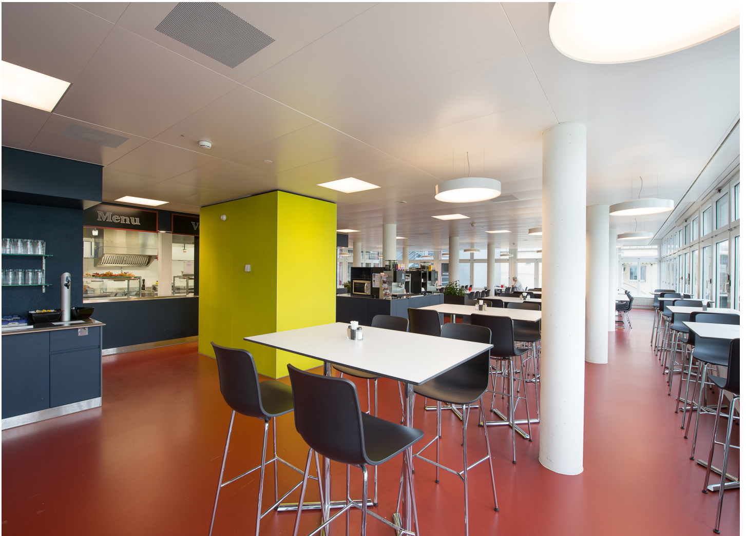
Emmi Personal-Restaurant Emmen