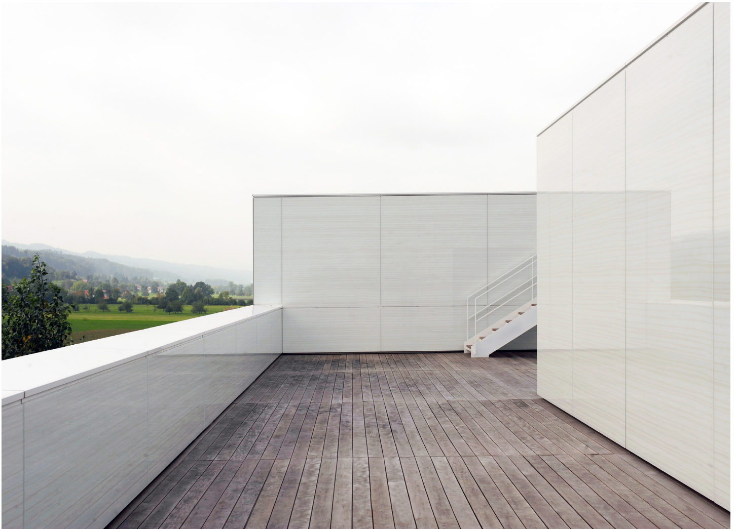
4B Office Hauptsitz Hochdorf